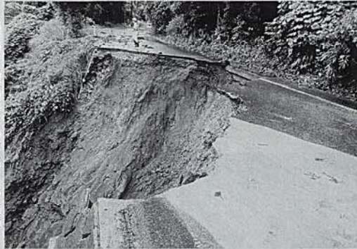
局所的な大雨で崩落し、通行止めになった奥道 —南砺市立野郎28日(真提供)

28日早朝に北陸地方を襲った豪雨被害で、県は29日、最も被害の大きかった南砺市に災害救助法を適用することを決めた。住宅の補修など、被災者への支援費用を県と国が折半する。適用は28日付。県内では同市の被害が最も大きく、民家3棟が全半壊、259棟が床上・床下浸水し、2人が軽傷を負った(29日午後3時現在)。床上・床下浸水は、県内の被害全体の約7割が同市に集中した。住宅被害では同法の適用条件を満たさなかったが、同日午後1時現在も5世帯8人が避難所生活をしており、県と厚生労働省は適用が可能なと判断した。廃材の撤去や被災住宅の応急修理、給水などの費用が支給される。また、県は同市で家が全壊の世帯に10万円、半壊世帯に5万円の見舞金を支給。被災者の移転なども支援する被災者生活再建支援法は要件を満たさず適用を見送った。被災地を視察した石井隆一知事は「1000年に1度と言われる豪雨で、県内は甚大な被害を受けた。早期の復旧に万全を期したい」と述べた。【茶谷亮】