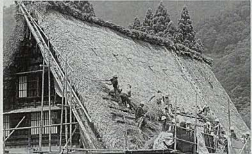
合掌家屋の屋根をふき替える職人や生徒ら—南砺市の舊沼合掌造り集落で

連日猛暑が続く中、「モイスチャーミスト」の社会実験が富山市総務部で実施された。冷たい霧を発生させる「モイスチャーミスト」を、富山で実験してプレッシャーを減らすことができた。壮行会後、グラウンドで練習をこなしたナインは、午後5時、生徒や教職員らが見守る中でバスで甲子園に向けて出発した。30日に甲子園見学、8月2日午前9時に開会式に臨み、5日の大会第4日第4試合(午後4時開始予定)で大阪(東愛知)と対戦する。宿泊は大阪市北区同心2、電話06・6242・2111。【富山都子】